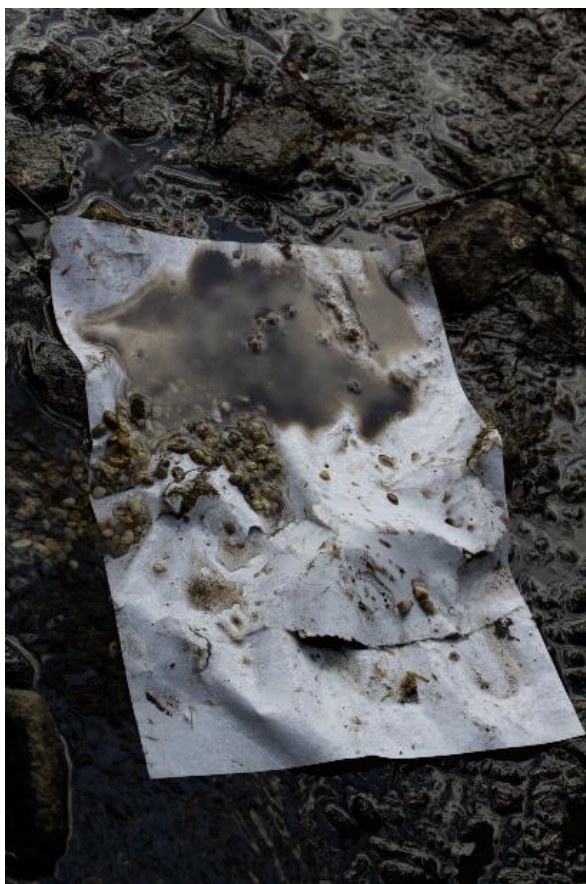
Fotografia 1: Obraz vody

Niečo nové? Niečo staré? Niečo zničené? Nie! Jednoducho. Je to tak! Nájdeš to všade! Papier vo vode. Papier s kameňmi. Papier pod nánosom. Všetko to obmývané vodou. Tá plynie. Bez návratu späť. (bk)