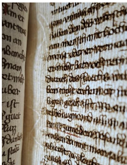
Obrázok č. 2: Fotografia časti filigránu zo skúmaného rukopisu

Rožmery zloženého listu od ľavého alebo pravého margu po stred sa pohybujú od 153 do 155 mm, pričom výška listu je 209 mm. Kniha je neštránkovaná. V rámci nášho rozboru sme strany knihy očíslovali (vkladáním lístkov s číslami, nie priamym vpisovaním číslíc do knihy), čo nás dovedlo k nasledovnému zisteniu. Rukopis obsahoval pravdepodobne celkom 324 strán. Zaznamenali sme úbytok 18 strán (9 listov), ktoré boli odstránené mechanicky, pravdepodobne prostredníctvom ostrého predmetu. Ide o strany 133 – 146 a strany 321 – 324. Tieto sme identifikovali vďaka viditeľným pozostatkom listov v rukopise. Váha v súčasnej podobe je 920 gramov.